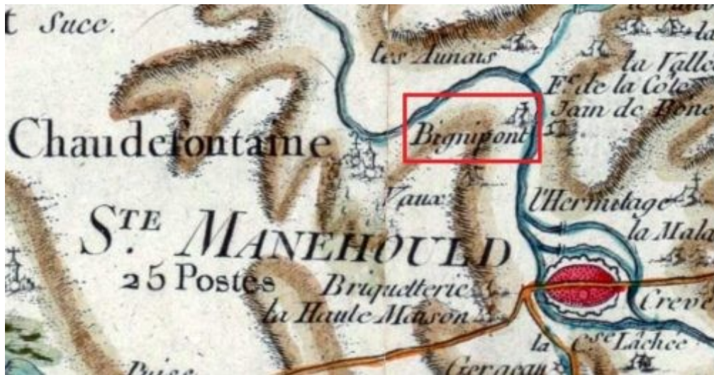
Carte de Cassini de Bignipont (à côté de Sainte Menehould)

(article tiré du site aupresdenosracines.com )